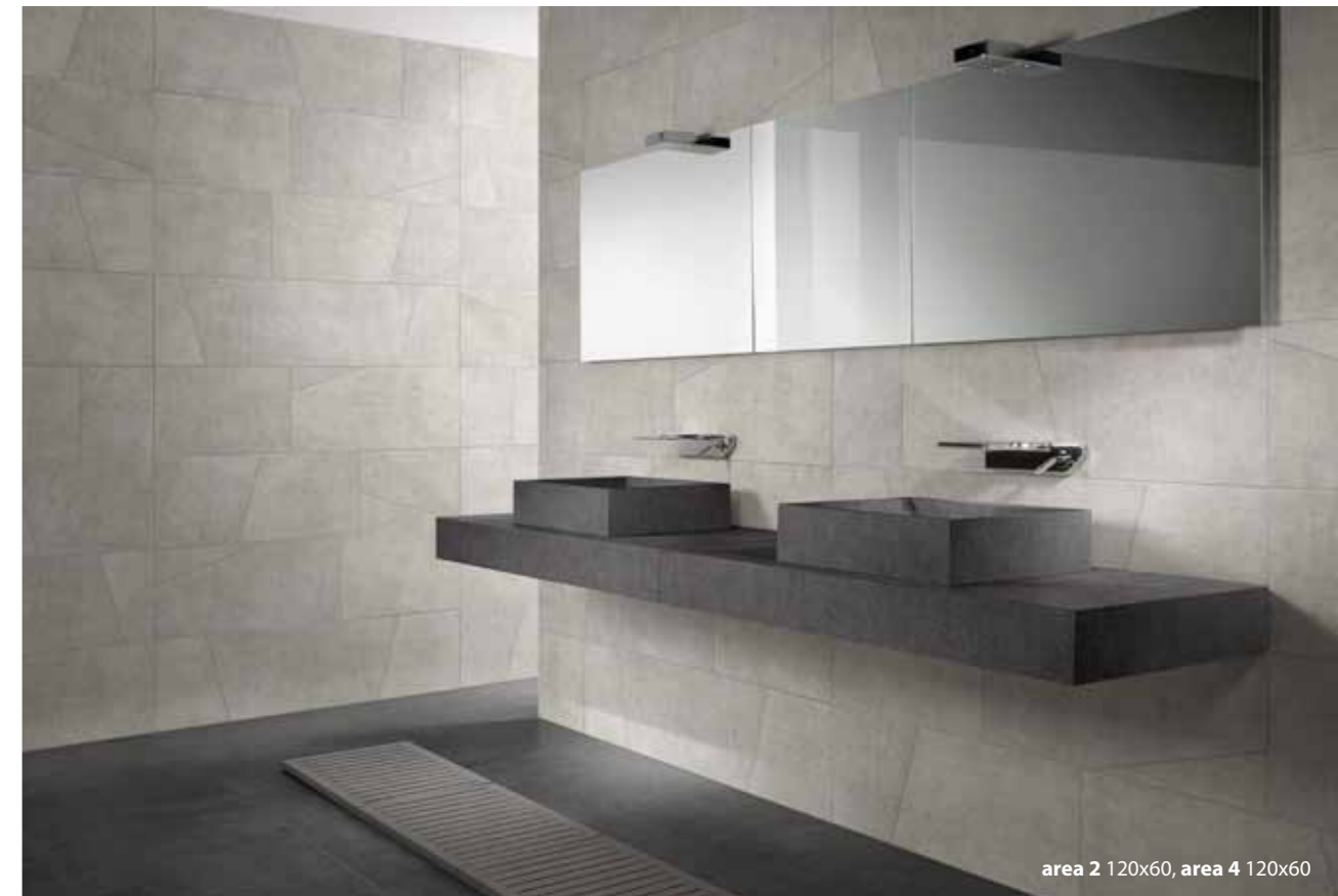
area 2 120x60, area 4 120x60