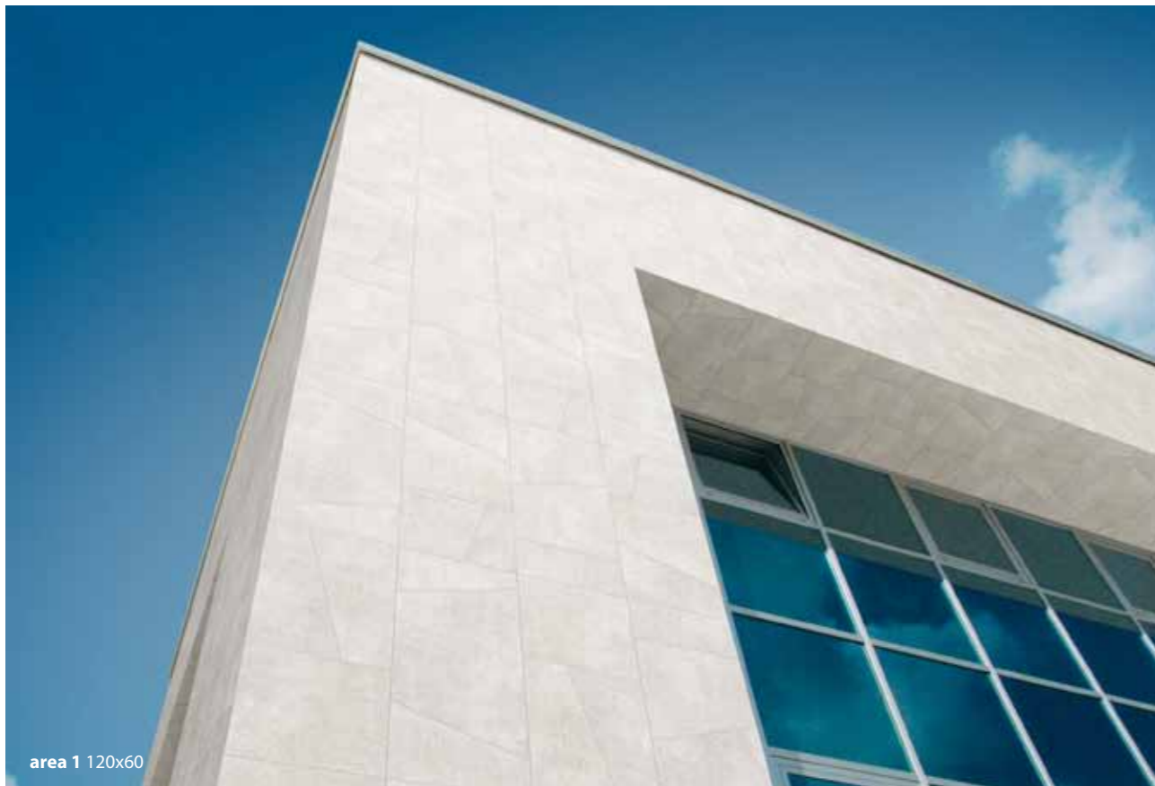
area 1 120x60