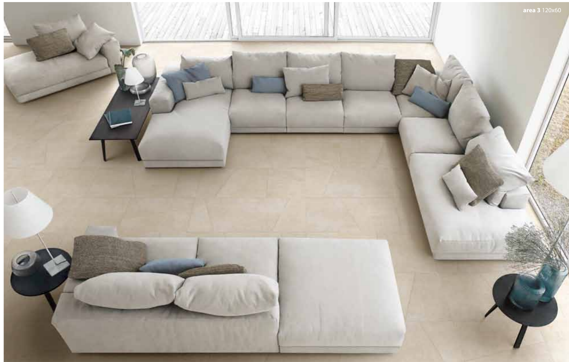
area 3 120x60